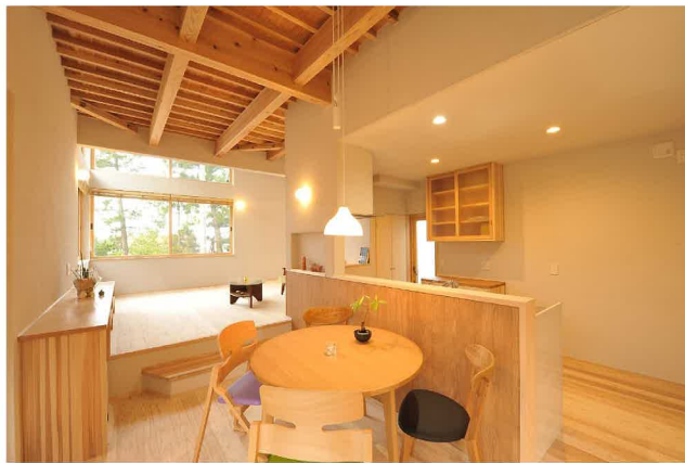
木づかいコンペ 2018 優秀賞受賞 「スキップする多面層の住まい」

本年もおかげさまで、多くのお客様の家づくりのお手伝いをさせて頂きました。また、3年連続で「木づかいコンペ」で優秀賞を受賞となり、このような機会を与えて下さいましたお客様と、一致団結で素晴らしい施工をして頂きました職人さんたちに感謝申し上げます。本当にありがとうございました。来年も感謝の心を忘れず、更なる成長と皆様にご満足して頂ける家づくりを目指しより一層邁進して参ります。