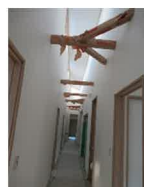
吹き抜けから差し込む光で廊下も明るく