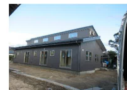
和洋折衷のスタイリッシュな外観