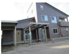
重厚感のある瓦屋根とレンガタイルの外観