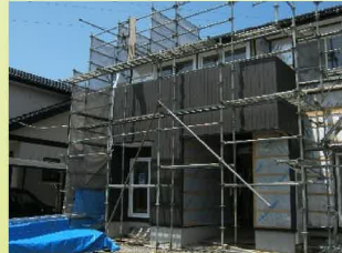
20年目の外装リフォーム