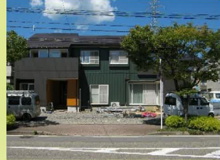
20年目の外装リフォーム