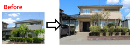
外壁塗り替え(シコソ3回塗り) After

外壁まわりのリフォームは建ててから10~20年がタイミングといわれています。建ててから10年以降の方で心配な方は一度、外壁回りの点検をおすすめします。