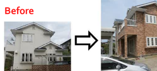
外壁張り替え(レンガタイル) After