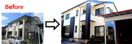
外壁張り替え(金属サテライト) After